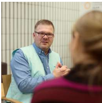
Vertaistukijaa motivoi tahto auttaa sairastuneita ja heidän läheisiään.

Vertaistuki on kuin vapaapäivä – tämä rinnastus on jäänyt mieleeni erään potilasjärjestön lehdestä. En heti keksi, kuka kaipaisi kipeämmin vapaapäivää kuin sairastunut. Vertaistuen tarjoama vapaapäivä tarkoittaa sitä, että kun saa jutella saman sairauden kokeneen kanssa, voi tuntea olevansa täysin samanlainen kuin toinen. Ei tarvitse pinnistellä – voi itkeä itkunsa ilman, että toinen yrittää pelastaa tai sääliä, tai voi heittää sairaudestaan vitsiä, jolle vain vertainen uskaltaa nauraa.