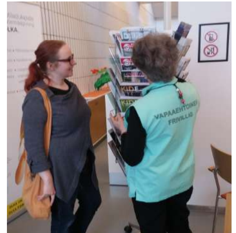
Potilastukipiste OLKasta saa tietoa ja tukea ilman ajanvarausta arkisin kello 8.30—14.

OLKA-piste, Syöpätautien klinikka (ent. Vertaistukipiste) sijaitsee sairaalan sisääntuloaulassa. OLKA-pisteellä kohdataan sairastuneita ja heidän läheisiään. Kävijä voi saada tukea ja ohjausta sairautensa kanssa elämiseen. Avoinna arkipäivisin, jolloin vapaaehtoinen vertaistukija tai potilasjärjestön edustaja on paikalla. Kuukausiohjelma julkaistaan Facebookissa: Potilastukipiste OLKA ja www.hus.fi/olka