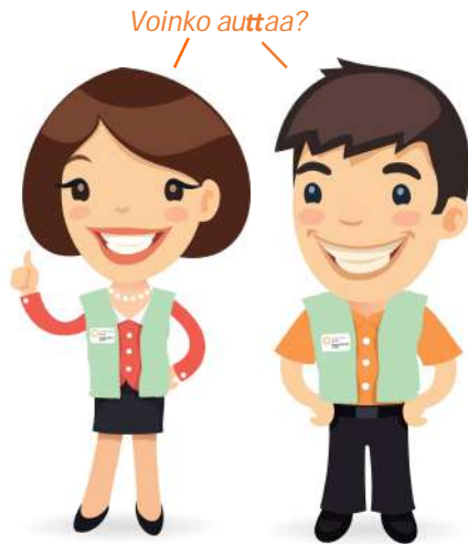
Vapaaehtoinen Ilona ja vertaistukija Toivo ovat OLKA vapaaehtoistoiminnan tunnushahmot.